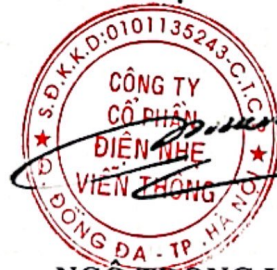
NGÔ TRỌNG VINH